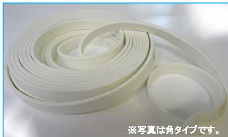
※写真は角タイプです。